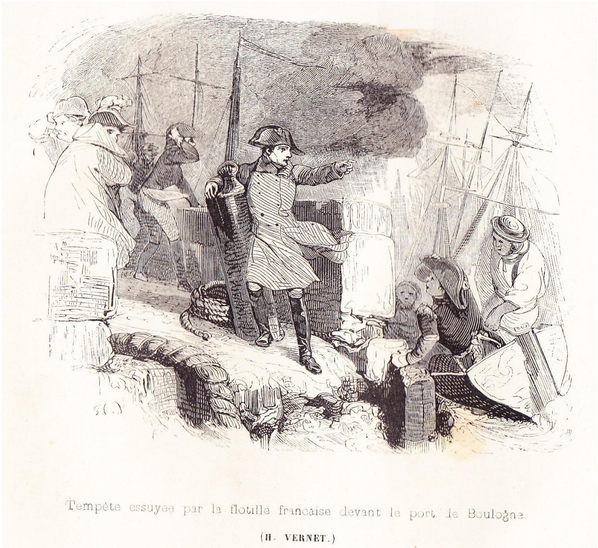
Tempête essayée par la flotille française devant le port de Boulogne.